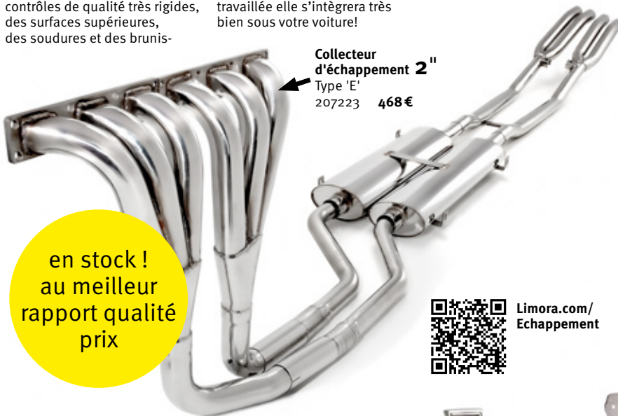
Collecteur d'échappement 2" Type 'E' 207223 468€

Mettez-la de côté aujourd'hui et installez-la cet hiver!